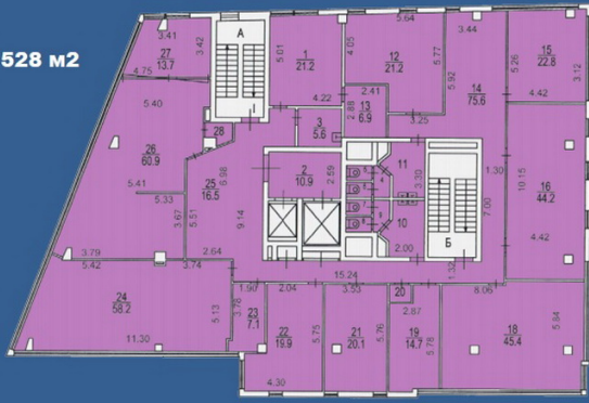
4 этаж - 528 м2